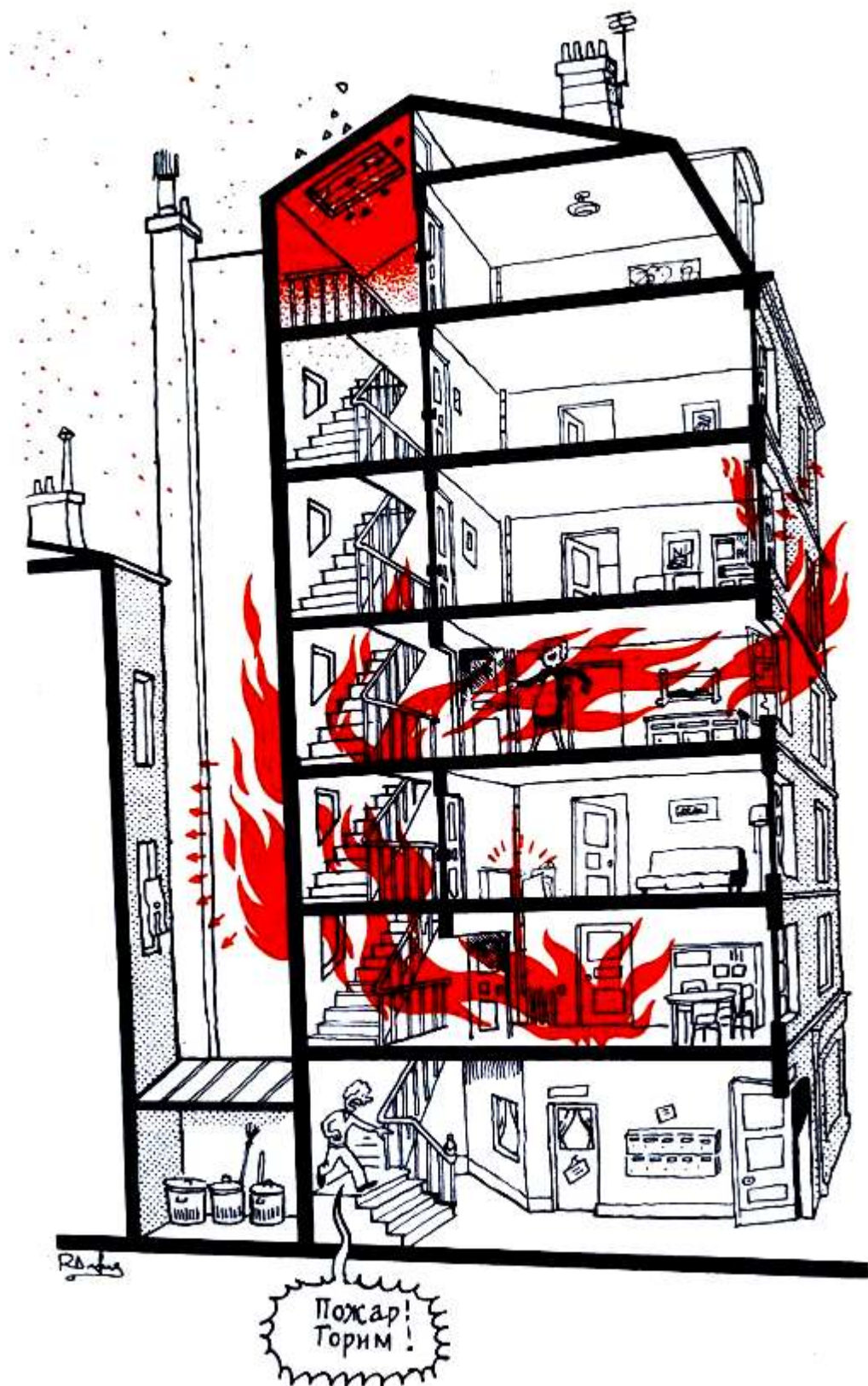
Рис.11. Пути распространения огня.