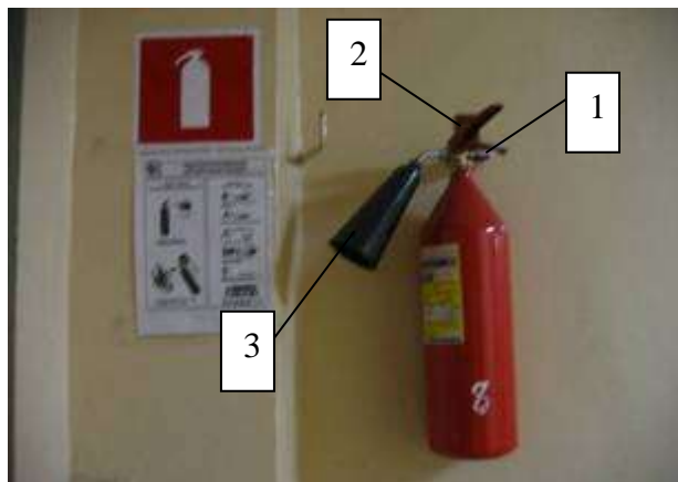
Рис.3. Общий вид огнетушителя.

Необходимо сорвать пломбу и вынуть блокирующий фиксатор (предохранительную чеку) (1), затем следует ударить рукой по кнопке запускающего устройства огнетушителя или воздействовать на пусковой рычаг (2), расположенный в головке огнетушителя, и направить огнетушащее вещество через ствол, насадку, раструб или шланг на очаг горения (3) (рис.3).