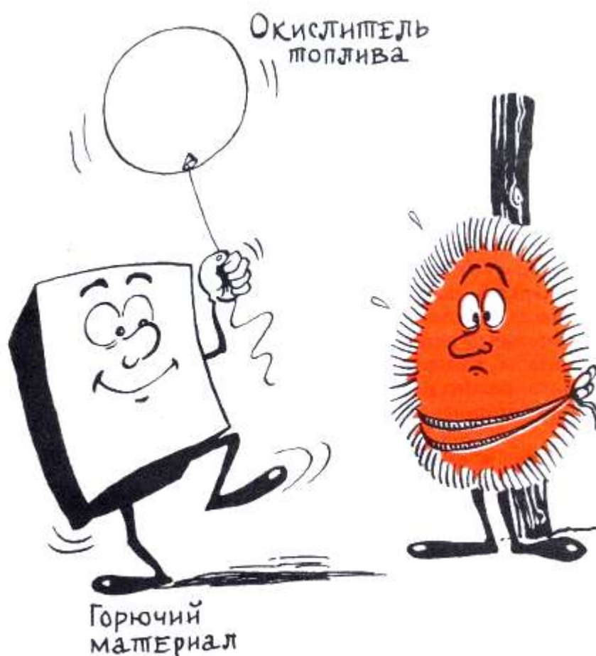
Рис.12. Способы борьбы с огнём.

Воздействие на окислитель. Углекислый газ, образующийся при тушении, уменьшает содержание кислорода в воздухе вокруг очага. При